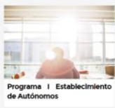
Programa I Establecimiento de Autónomos

El Decreto 168/2022, de 30 de diciembre , establece cuatro programas de ayudas para el autoempleo.