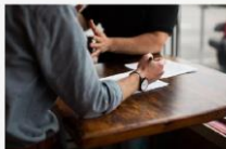
Programa II Inserción familiar colaborador

Normativa: DECRETO 168/2022, de 30 de diciembre , por el que se establecen las bases reguladoras de las subvenciones y se prueba la convocatoria, para el ejercicio 2023-2024