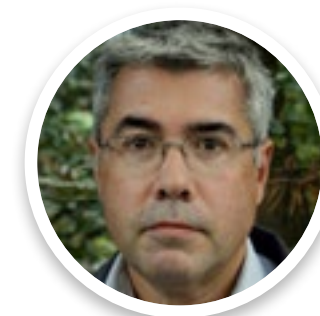
Jaime Izquierdo Comisionado para el Reto Demográfico del Principado de Asturias