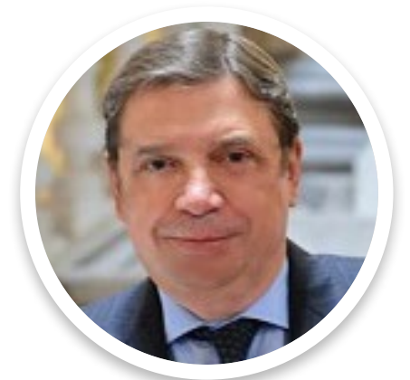
Luis Planas Puchades Ministro de Agricultura, Pesca y Alimentación