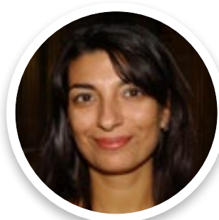
Isabel Bombal Directora general de Desarrollo Rural, Innovación y Formación del Ministerio de Agricultura, Pesca y Alimentación