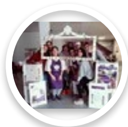
Cooperativa de comida a domicilio Lovepamur Saldaña (Palencia)