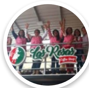
Cooperativa Las Rosas Coffee Colombia