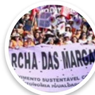
A Marcha das Margaridas Brasil