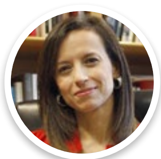
Beatriz Corredor Presidenta Red Eléctrica de España