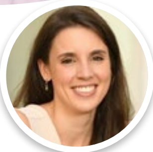
Irene Montero Ministra de Igualdad