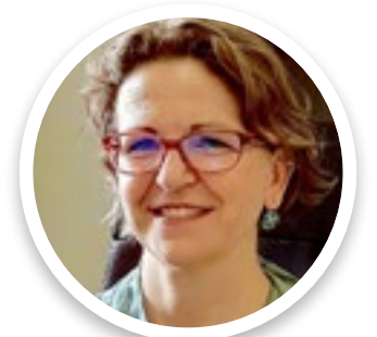
Elena Cebrián SG Reto Demográfico Ministerio para la Transición Ecológica