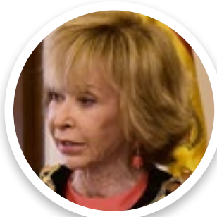
Mª Teresa Fernández de la Vega Presidenta Fundación Mujeres Por África