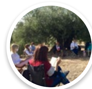
La Silla de Anea