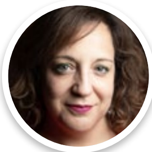
Iratxe García Pérez Presidenta Grupo SyD Parlamento Europeo