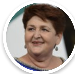
Teresa Bellanova Ministra de Agricultura Italiana